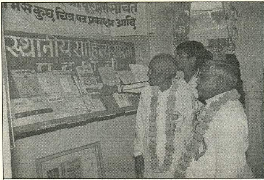
राजस्थानी साहित्य प्रदर्शनी का अवलोकन करते हुए।