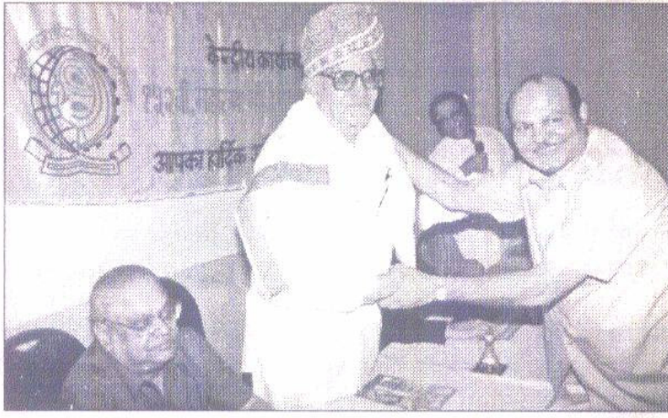
विशिष्ट अतिथि श्री लाटा द्वारा