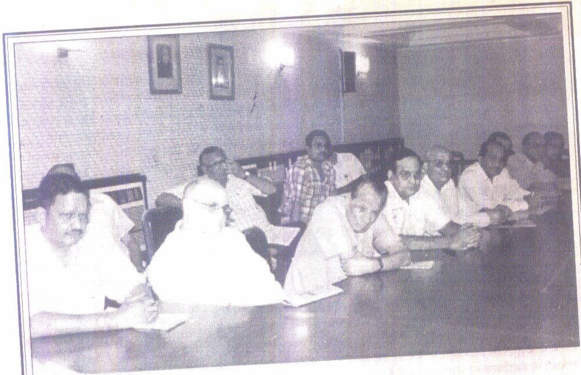
पत्रकारों की संगोष्ठी में उपस्थिति का अंश