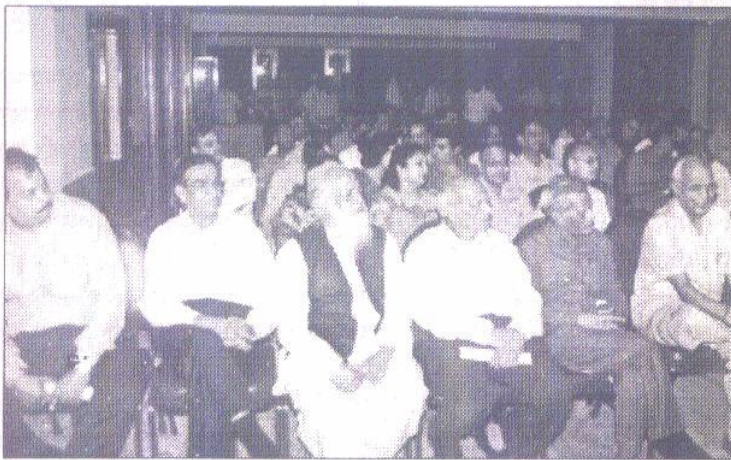
उपस्थिति का छोटा सा अंश