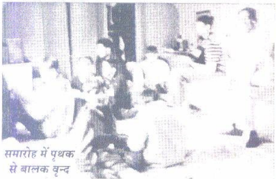
समारोह में पृथक से बालक वृन्द

लंदन में हुए राजस्थानी फाउण्डेशन के उद्घाटन समारोह में लगभग २२० समाज बन्धुओं की उपस्थिति रही। लंदन में सम्मेलन द्वारा राजस्थानी फाउण्डेशन की स्थापना विश्व भर में फैले मारवाड़ी समाज को एकसूत्र में बांधने एवं देश में सम्मेलन के माध्यम से समाज के साथ एक नवीन सम्बन्ध स्थापित करने की