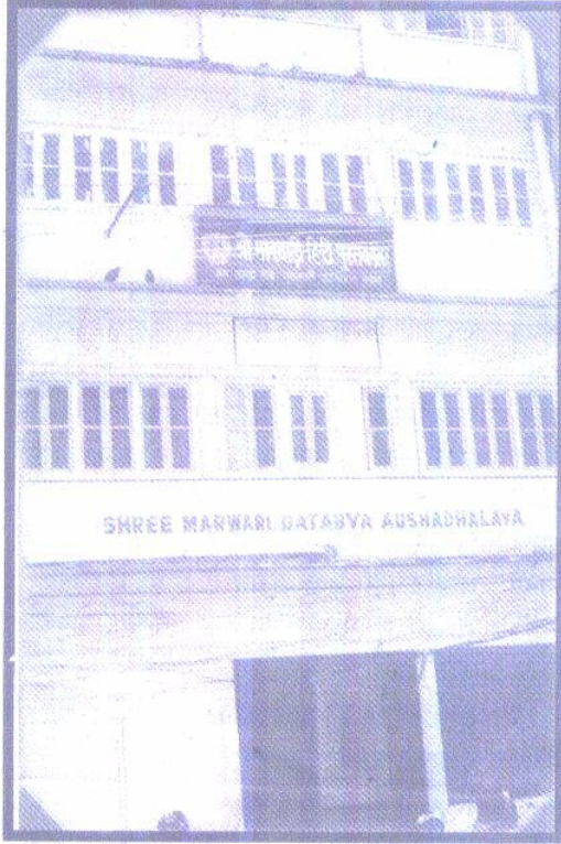
श्री मारवाड़ी दातव्य औषधालय