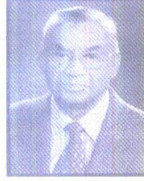
उपाध्यक्ष रामगोपाल हरलालका