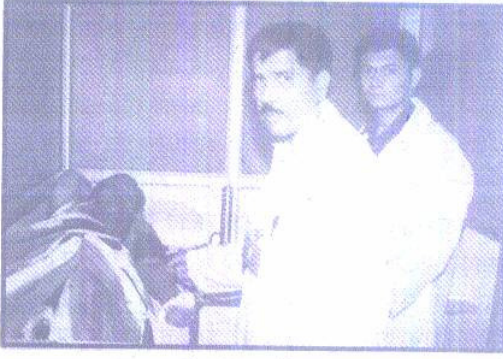
जच्चा की जांच करते हुए डाक्टर