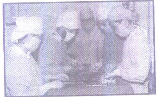
आपरेशन करते हुए डाक्टरों की टीम

इस अस्पताल में प्रसुति के अलावा भी महिला रोगों की जाँच की जाती है। लेबोरेटरी विभाग व सोनोग्राफी