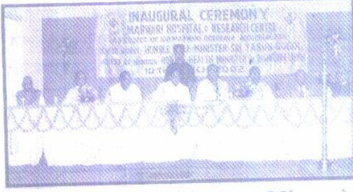
मारवाड़ी हॉस्पिटल एवं रिसर्च सेंटर का नव निर्मित भवन के उद्घाटन समारोह के अवसर पर लिया गया चित्र