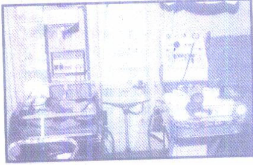
प्रसूतिगृह का आधुनिकतम शिशु कक्ष

सेवाओं का लाभ उठाने में संकोच नहीं करें। एक चिकित्सा संस्थान की विश्वनीयता एवं मान्यता के लिए आवश्यक है कि इस संस्थान की सेवाओं का उपयोग समाज के सभी वर्गों द्वारा किया जाए। मारवाड़ी हॉस्पिटल एण्ड रिसर्च सेंटर के चिकित्सा तंत्र का निर्माण भी उन्हीं उद्देश्यों पर आधारित होगा।”