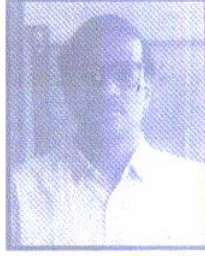
अध्यक्ष लोकनाथ मोर