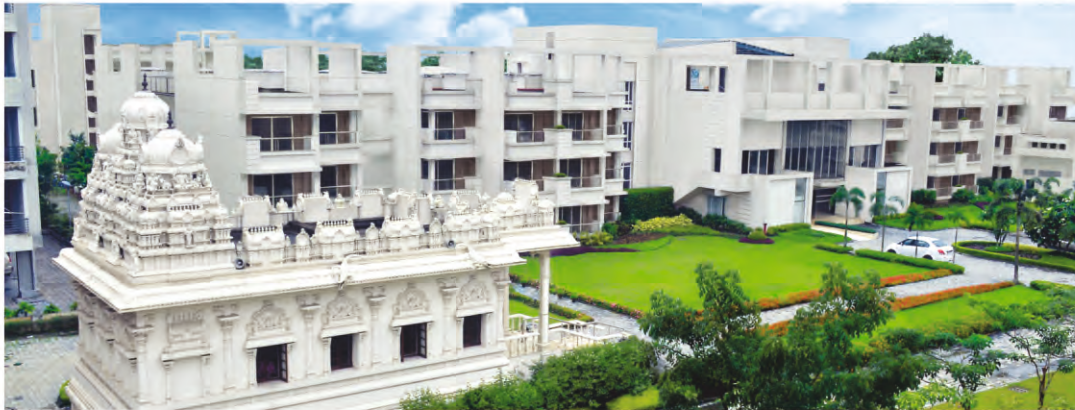
KOLKATA'S MOST COMPREHENSIVE HOME FOR SENIOR LIVING