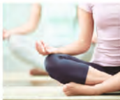
Yoga & meditation