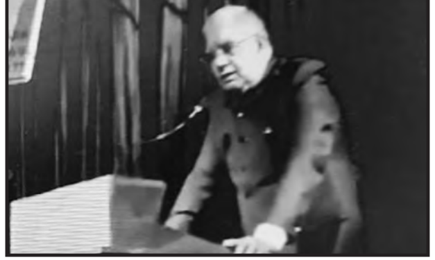
समारोह को सम्बोधित करते महामहिम राज्यपाल श्री जगदीप धनखड़।