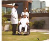
24 x 7 Medical care