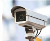
Safety and Security