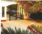
Privilege access to IBIZA Club