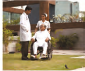
24 x 7 Medical care