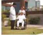
24 x 7 Medical care