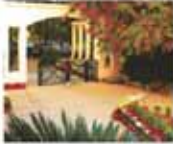
Privilege access to IBIZA Club