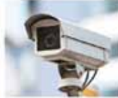
Safety and Security