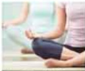
Yoga & meditation

KOLKATA'S MOST COMPREHENSIVE HOME FOR SENIOR LIVING