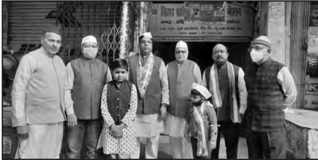
गणतंत्र दिवस अनुपालन