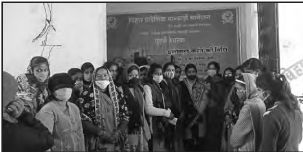
पुपरी शाखा के द्वारा चयनित विद्यालय में सेनेटरी पैड वैंडिंग मशीन की स्थापना