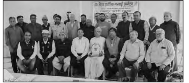
बिहार सम्मेलन की १६०वीं शाखा "शाहपुर पटौरी" गठित