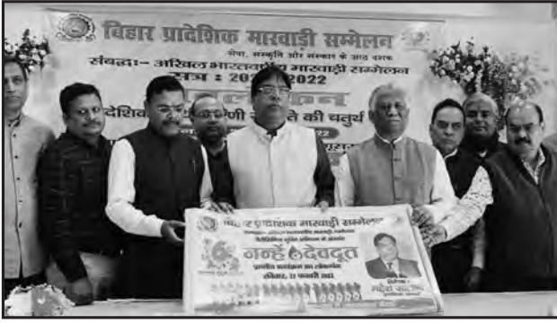
थैलेसीमिया से बचाव के लिए जन-जागरूकता अभियान “नन्हें देवदूत” प्रादेशिक कार्यक्रम का लोकार्पण

समाजबंधुओं से अपने घर-परिवार में और रिश्तेदारों से मारवाड़ी में वार्तालाप करने का अनुरोध किया गया।