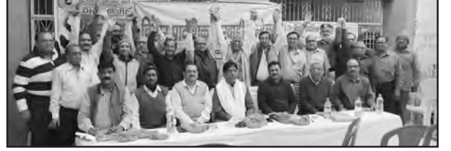
संगठन यात्रा के दौरान मुंगेर प्रमंडल मुख्यालय शाखा में समाजबंधुओं के साथ बैठक

२१ फरवरी को मायड़ भाषा दिवस के अवसर पर समस्त