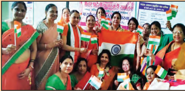
पूर्वोत्तर प्रा.मा.स. के बरपेटा रोड महिला शाखा द्वारा