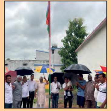
उत्कल प्रांत के बरपाली शाखा और जयपटना शाखा द्वारा