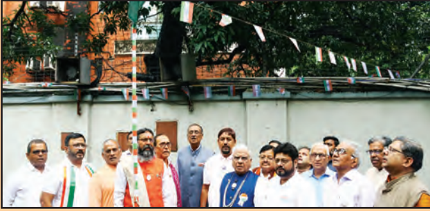
केन्द्रीय कार्यालय में सम्मेलन के पदाधिकारी एवं सदस्यगण