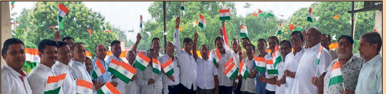
उत्कल प्रांत के केसिंगा शाखा के पदाधिकारी एवं सदस्यगण