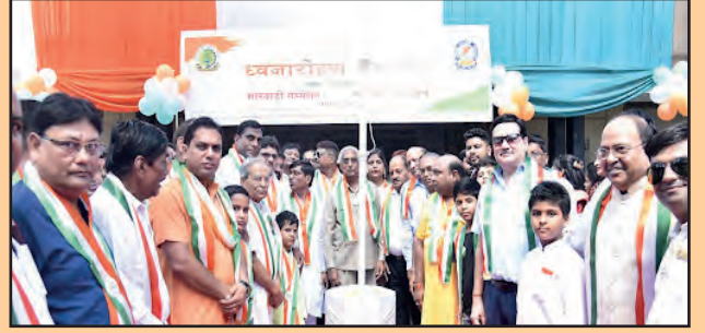
पूर्वोत्तर प्रा.मा.स. के नगाँव शाखा के पदाधिकारी एवं सदस्यगण।